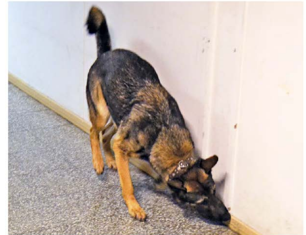
HOMEKOIRAN KÄYTTÖ KIINTEISTÖSSÄ ESIINTYVIEN MIKROBIPERÄISTEN HAJUJEN TARKASTUKSESSA - TILAAJAN OHJE